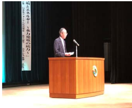
つがる市福島市長挨拶