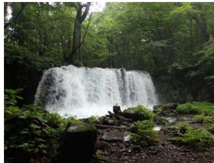
(2019/7/16 子ノ口制水門放流量5.2m 3 /S)

このことは9月20日のデーリー東北でも取り上げられ、『銚子大滝 水量半分以下に』、『奥入瀬の名瀑 迫力不足』との記事が載り、観光面への影響について危惧する意見も掲載されました。記事のように、この時期に奥入瀬溪流を訪れた観光客の中には、がっかりされた方もいたかもしれません。