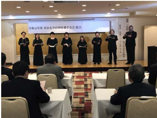
「弘前バッハアンサンブル」演奏

総会終了後、声楽器楽混成団体「弘前バッハアンサンブル」による演奏会を行いました。 （参加者：40名）