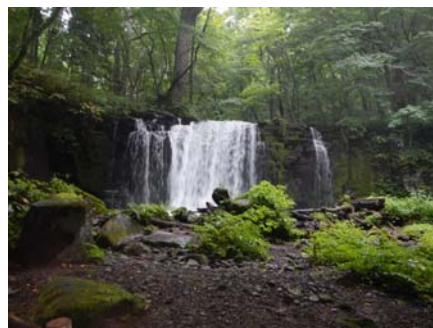
(2019/9/11 子ノ口制水門放流量0.24m 3 /S)