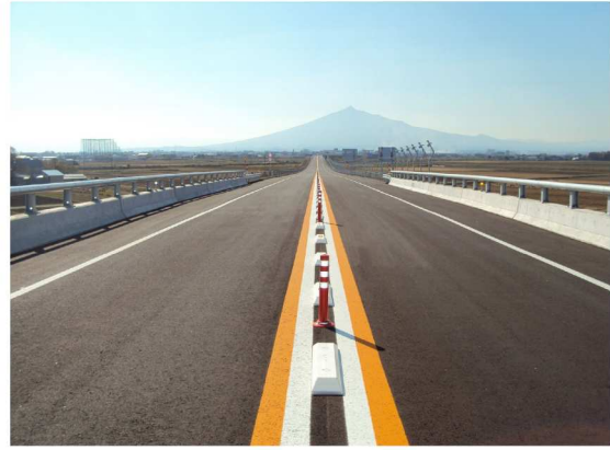
正面に見える岩木山